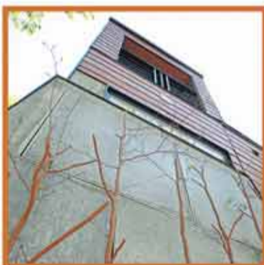
Ce plan légèrement incliné, couvrant le bas de la façade à gauche, est constitué d'une dalle de fibrociment décorée de petits arbres bien verticaux qu'on a dû faucher pour construire.

La maison en conteneurs fait partie du circuit de la Fondation Saint-Bernard. On pourra donc la visiter le 5 août prochain, de même que quelques autres bâtiments d'intérêt de Sainte-Adèle. Infos: 1-877-229-7731.